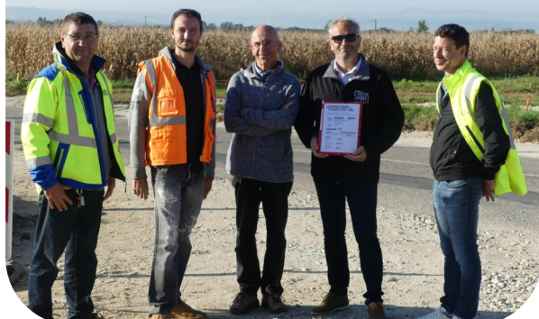
Réunion de chantier

Au stade, les travaux de la 2ème tranche ont commencé : délimitation des espaces et réseaux : arrosage, éclairage, et assainissement, ce dernier servira aussi à la salle du stade.